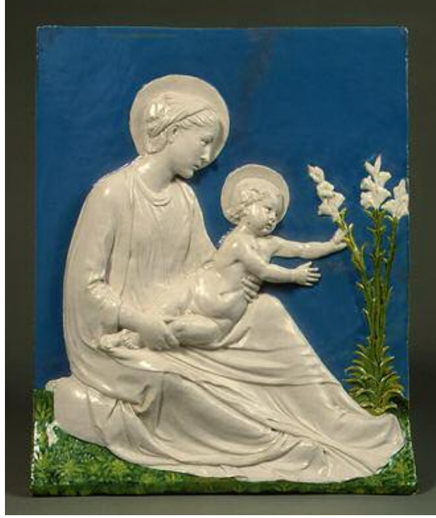
لوکادیلارۆبیا Luca della Robbia